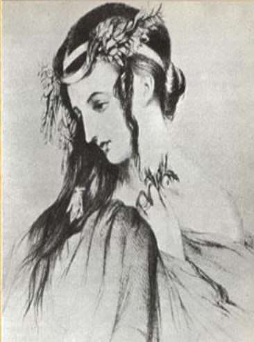
Harriette Smithson nel ruolo di Ofelia